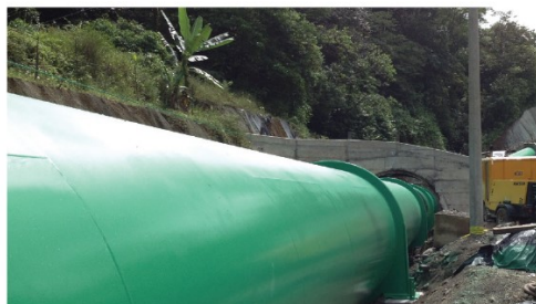
• PH Balsa Inferior (2014) Costa Rica, Área Total: 21.046 m2