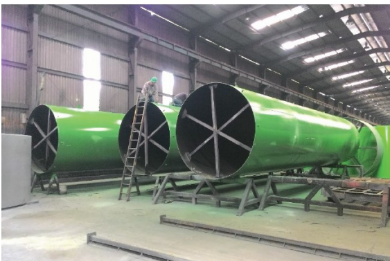
• PH El Recreo (2014-2015) Guatemala, Área Total: 26.928 m2.

Plantas hidroeléctricas ubicadas en Guatemala, Honduras, El Salvador, Costa Rica, Nicaragua y Panamá, son la clara evidencia de la preferencia de este sector por los productos BECC.