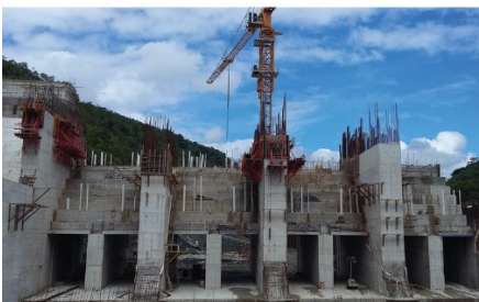
• PH OXEC II (2016) Guatemala, Área Total: 20.475 m2