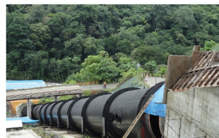
• PH Bajo Minas (2010) Panamá, Área total: 12800 m2