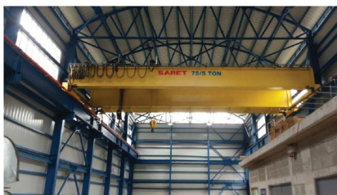
• PH OXEC I y Sifón (2014-2015) Guatemala, Área Total: 20.400 m2